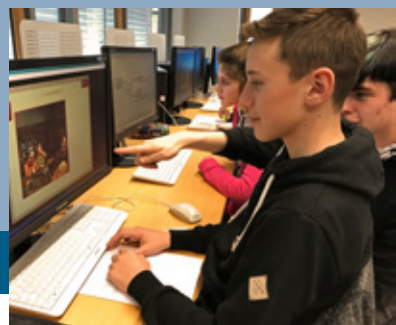
Angewandte Informatische Bildung