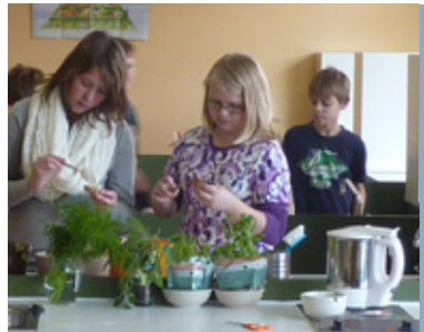
Hauswirtschaft und Sozialwesen