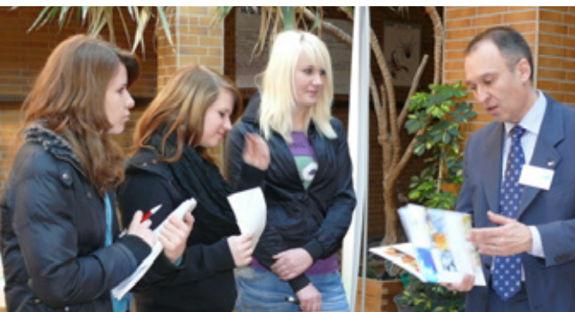
Impressionen von der Berufsinfobörse