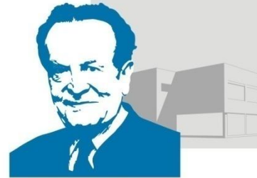
Philipp Freiherr von Boeselager Realschule plus Ahrweiler