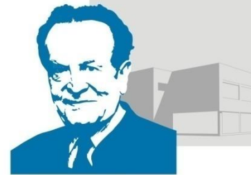
Philipp Freiherr von Boeselager Realschule plus Ahrweiler