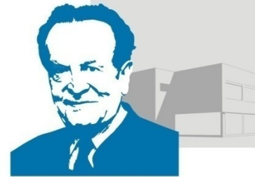
Philipp Freiherr von Boeselager Realschule plus Ahrweiler