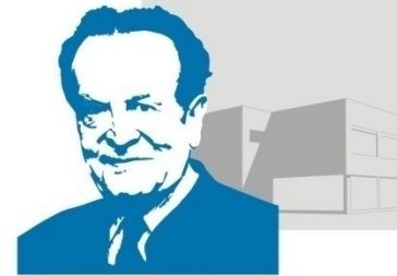
Philipp Freiherr von Boeselager Realschule plus Ahrweiler