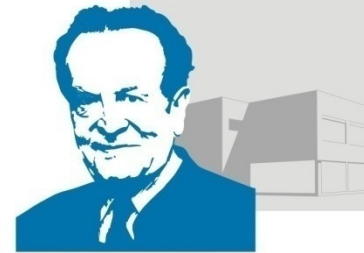
Philipp Freiherr von Boeselager Realschule plus Ahrweiler