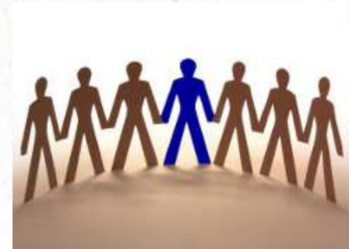
Leben in Gemeinschaft