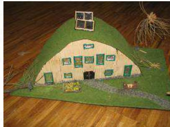
Ein fertiges Wohnmodell