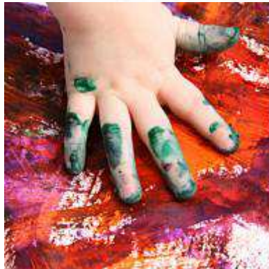
Entwicklung des Kindes