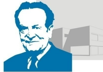
Philipp Freiherr von Boeselager Realschule plus Ahrweiler